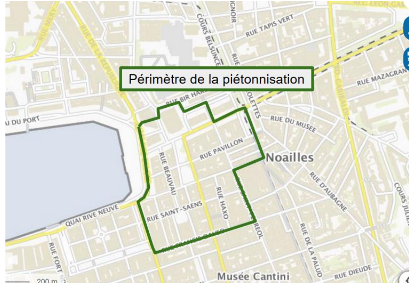
Zonage de prédilection pour la livraison en vélo